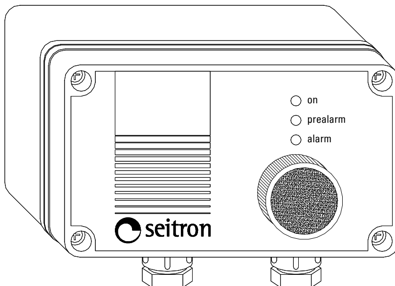
Fig. 1 Aspetto esteriore / External aspect / Aspect extérieur / Aspecto exterior

Via del Commercio, 9/11 36065 MUSSOLENTE (VI) - ITALY Tel.: +39.0424.567842 Fax.: +39.0424.567849 http://www.seitron.com e-mail: info@seitron.it