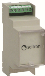
Fig. 1:Aspetto esterno / External aspect

Via del Commercio, 9/11, 36065 Mussolente (VI) ITALY Tel.: +39.0424.567842 - Fax.: +39.0424.567849 http://www.seitron.it - e-mail: info@seitron.it